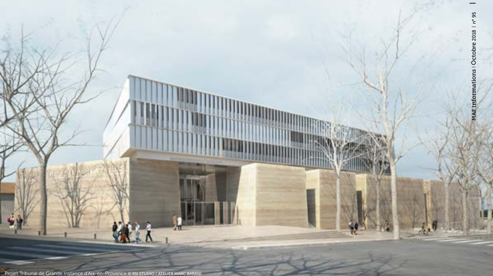
Projet Tribunal de Grande Instance d'Aix-en-Provence © RSI STUDIO / ATELIER MARC BARANI.

les assureurs en responsabilité civile décennale (RCD) des constructeurs.